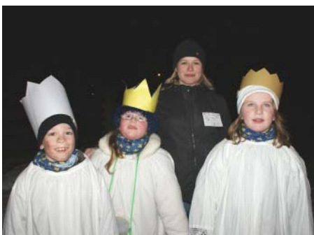
Tříkrálové sbírce tentokrát neprálo počasí, zato výtěžek ukázal štědrost a dobré srdce dárců.