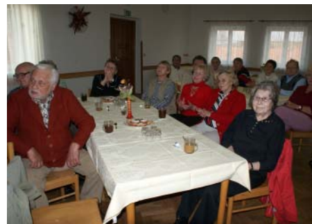
Publikum bylo s předvedenými výkony nadmíru spokojeno.