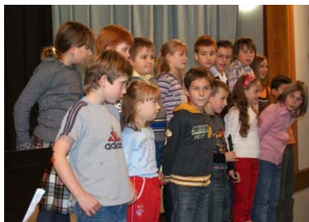
Hudební pásmo žáků základní školy.