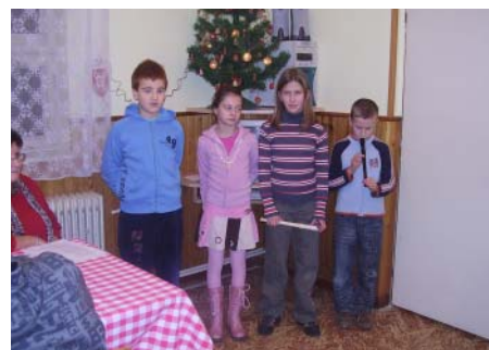
Žáci ZŠ zpestřili také program výroční schůzky hasičů.