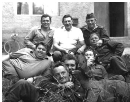
Soutěžní družstvo SDH Tisová.

V roce 1985 se tisovský sbor rozloučil s Tatrrou 805, kterou nahradil starší terénní vůz značky ARO. V tom-