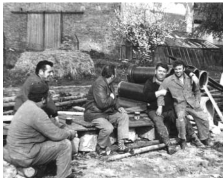
Brigádníci při chvilce oddechu na stavbě požární zbrojnice (1984).