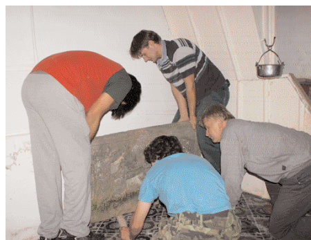
O převoz náhrobního kamene z márnice tisovského hřbitova do kaple sv. Vojtěcha se postarali mladí hasiči.