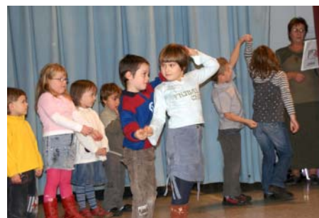
Z vystoupení předškoláčků.