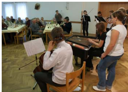
Žáci Základní umělecké školy Choceň přijeli i s cimbálem.