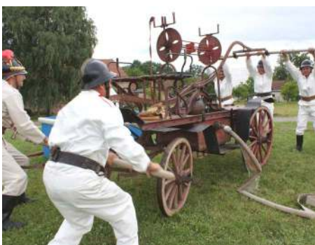
Na závěr červnových oslav 100. výročí Sboru dobrovolných hasičů v Týništičku na Vysokomýtsku přijela stará hasičská garda s ruční historickou stříkačkou taženou koňmi.

6. června se na náměstí ve Vysokém Mýtě uskutečnil sraz historických hasičích stříkaček, které vyráběla firma Stratílek. Podívaná na tuto techniku byla opravdu parádní. Tisovský sbor zde při příležitosti 110. výročí založení této firmy prezentoval historickou