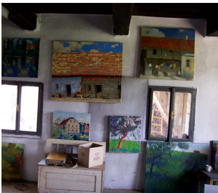
Výstava na statku č.p. 18 U Jenišťů.