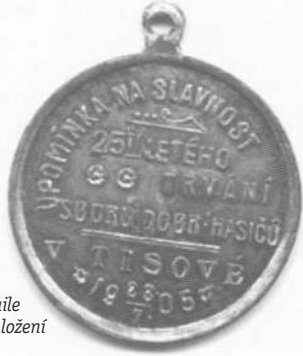
Pamětní medaile k 25. výročí založení SDH v Tisové