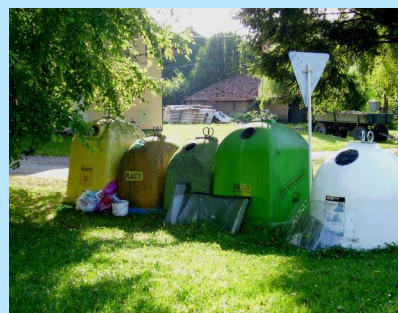
Krise - nekrize, pořádek bychom si měli umět zachovat.

Stále kolem sebe slyšíme slovo krize. Města a obce pocítily nižší daňovou výtěžnost a podle toho upravily své rozpočty. I pro naši obec znamenají nižší příjmy omezené možnosti nové výstavby a údržby stávajícího vybavení. To jistě chápe každý občan.