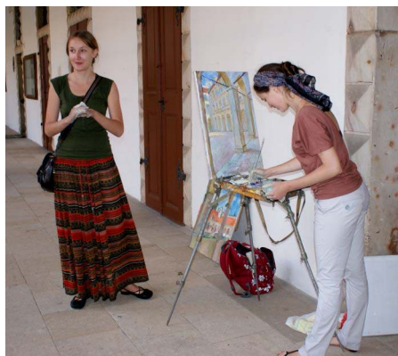
Účastníci plenéru na druhém zámeckém nádvoří v Lito-myšli.

Jak se jim to povedlo, mohli posoudit ti, kteří přišli