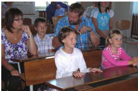
První den ve škole je v životě člověka důležitý mezník.

A už nám to zase začalo. První školní měsíc máme už za sebou. Všichni školáci si už téměř zvykli na to, že musí každý den dříve vstávat a že je dopoledne čeká spousta práce a námahy. Měsíc září patří ve škole k opakování a připomínání si, co jsme se v minulém školním roce naučili. Nyní už všichni zabírají ze všech sil, aby si ze školy odnesli co nejvíce vědomostí a dovedností.