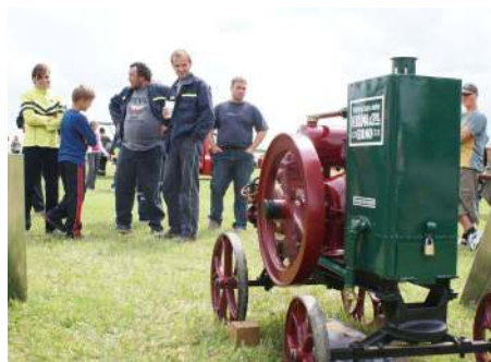
Historická parní stříkačka byla k vidění při slavnostech 100 let SDH v Týništičku.