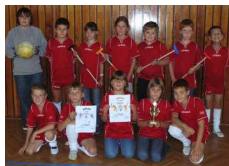
Úspěšní tisovští školáci. Blahopřejeme!