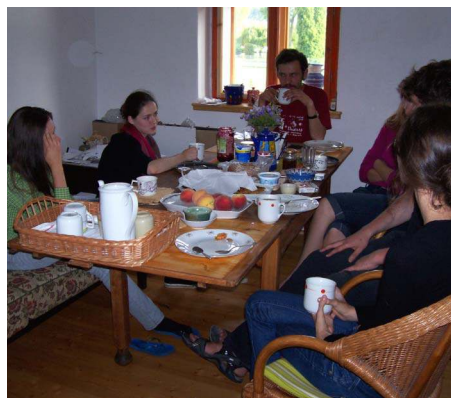
Ukrajínští výtvarníci v chvilce oddechu.