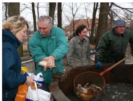
Že rybí maso patří k nejzdravějším, to Tisováci dobře vědí.