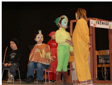
V úvodu setkání vystoupily děti z mateřské i základní školy.