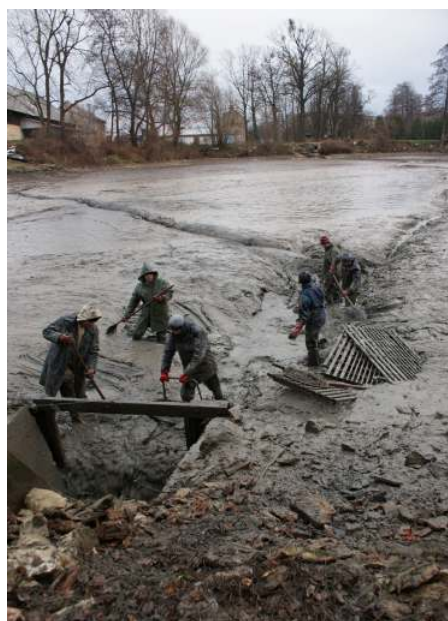
Těžká práce na bahnitě dně vypuštěného rybníka.

V sobotu 29. listopadu se uskutečnil tradiční výlov Bačova rybníku v Tisové. Kromě obvyklých ryb, jako je kapr, bylo vyloveno například několik tolstolobíků či štik a v kádích bylo možné spatřit i raky.