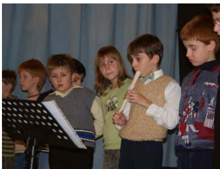
Hra na flétničky patří k náplni školní práce žáků...

Prvňáčkové již pěkně čtou, umí napsat některá písmena, sestavují z nich slabiky, slova i krátké věty. V matematice počítají a odčítají, řeší jednoduché slovní úlohy. Stali se z nich už opravdoví školáci. Jejich hod-