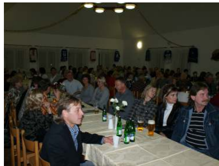
Sál se postupně zaplnil bývalými i současnými hráči a jejich manželkami či přítelkyněmi.