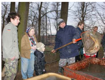
Kapra nebo štiky? A kolik kilogramů má vážit?

O koupi ryb, v řadě případů určených již na štědrovečerní tabuli, byl mimořádný zájem. U vypuštěného rybníka bylo kolem plných kádí, hořčičného ohníčku i stánku s občerstvením opravdu veselo.