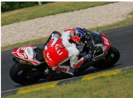
Aleš Halámek na trati v maďarské Pannonii.

1. Kamil Prager, Kawasaki, 111 bodů (25, 25, 20, 16, 25), 2. Petr Čermák, Yamaha, 66 (-, 16, 25, 25, -), 3. Aleš Halámek, Yamaha, 65 (20, 9, 10, 10, 16). -red-