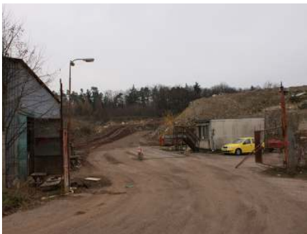
Kapacita skládky v Chocni bude naplněna na konci února.