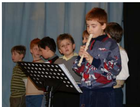
... a přináší své výsledky.

Ke konci roku bychom také chtěli poděkovat a popřát hodně úspěchů a zdraví i těm, kteří nám v tomto roce udělali velkou radost. Jsou to firma Profistav, která