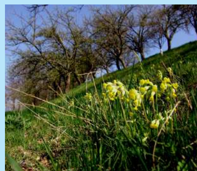
Prvosenky na svazích nad Tisovou jsou typickým poslem jara.

Vážený spoluobčané, určitě všichni věříme, že paní Zima je už za námi a my se na sluníčku konečně ohřejeme. Po mnoha letech jsme byli svědky přivítání prvního jarního dne společně s Velikonočními svátky a následným posunutím času o hodinu kupředu. Většina z nás má s příchodem jara a teplejšího počasí chuť mimo jiné plánovat, co a jak v letošním roce uděláme, co si koupíme a co už asi neuděláme a co už asi nekoupíme, protože na to už nebudeme mít.