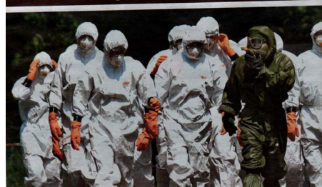
O ptačí chřipce informovali i holandské bulvárni deníky...