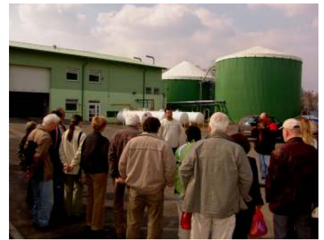
Fermentační (neboli bioplynová) stanice ve Šnakově je ve zkušebním provozu. Během Dne Země ve Vysokém Mýtě 1. dubna se uskutečnila exkurze do tohoto zařízení.

Bioodpad. Slovo, které je v poslední době často diskutováno. V podstatě se jedná například o posečenou trávu, plevele, shrabané listy, drobné větvičky ze stromů, staré rostliny, odpady z potravin a zeleniny. Zkrátka bioodpad, který jsme ještě nedávno házeli do kompostů nebo na domácí hnojště. Dnes se stává odpadem, o který se musí postarat obec. Tisová má v tomto směru velkou výhodu, že nedaleké město Vysoké Mýto vybudovalo tzv. fermentační stanici, kam se bude tento bioodpad, sice za poplatky, svážet ze širokého okolí. Tato stanice dokáže bioodpad přeměnit na teplo a elektrickou energii. Nyní je stanice již ve zkušební době. Máme přislíbeno, že v měsíci květnu bude možno pomocí kontejnerů navážet bioodpad i z Tisové. Podmínkou ovšem bude, že v kontejneru se nebude nacházet nic, co do bioodpadu nepatří, protože takový kontejner se musí odvézt na skládku za poplatek několikanásobně vyšší. O umístění kontejnerů a o datu odvozu budou občané včas informováni. Vojtěch Eliáš