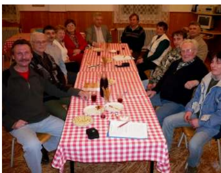
Členové sdružení při výroční schůzi.