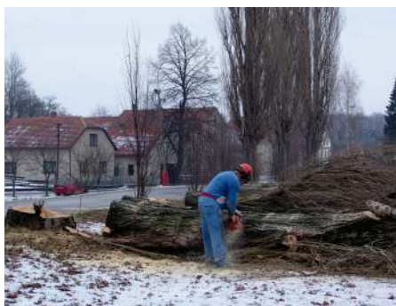
Kácení topolů u fotbalového hřiště.

V zimních měsících bylo po několikaletém dohadování přistoupeno k celkem masivnímu vymýcení prarostlých stromů, jejichž poloha a zdravotní stav již ohrožovaly bezpečnost a majetek občanů. Asi nejviditelnějším zásahem je stromořadí topolů kolem fotbalového hřiště. Jejich stav už skutečně ohrožoval bezpečnost chodců i projíždějících aut.