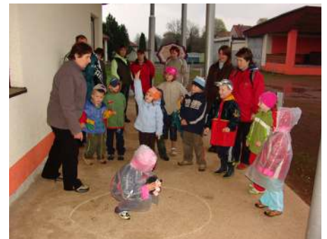
Odpolední vycházku si užily nejen děti, ale přivítali ji i jejich rodiče.