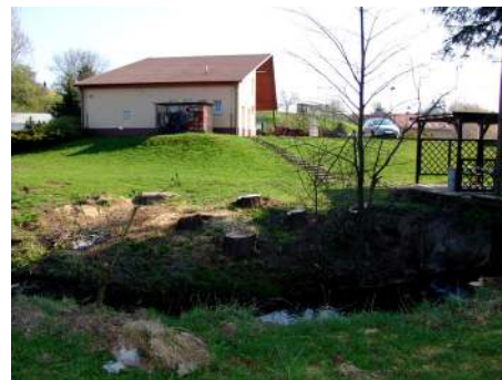
Stromy u čerpací stanice padly kvůli bezpečnosti.