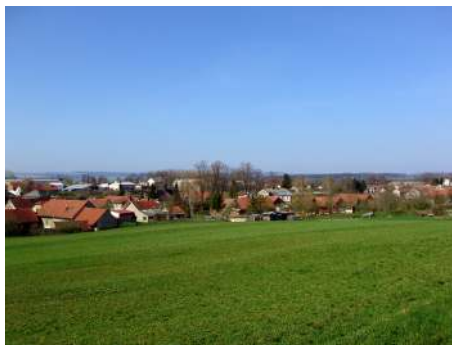
Jarní období vyzívá k vycházkám do přírody. Stačí vystoupat o pár metrů výš, abychom viděli, jak je v Tisové krásně...