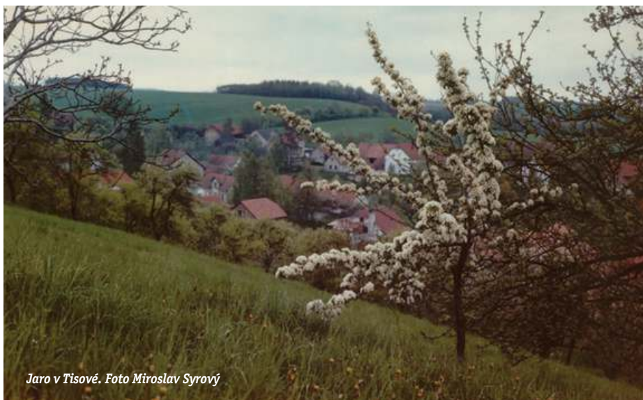
Jaro v Tisové.

Zastupitelstvo obce se v letošním roce sešlo čtyřikrát na řádných zasedáních a mimořádně dvakrát. Na těchto zasedáních mimo jiné projednávalo rekonstrukci obecního sálu, uskutečnění obecního plesu či podání žádosti o grant na výstavbu víceúčelového hřiště za školou. Rozpočet obce na letošní rok bude schvalován na veřejném zasedání Zastupitelstva obce, které se uskuteční v úterý 27. března od 18 hodin.