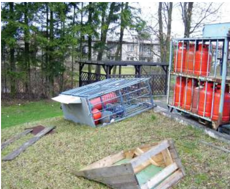
Kyrril řádil i v okolí čerpací stanice v Tisové...