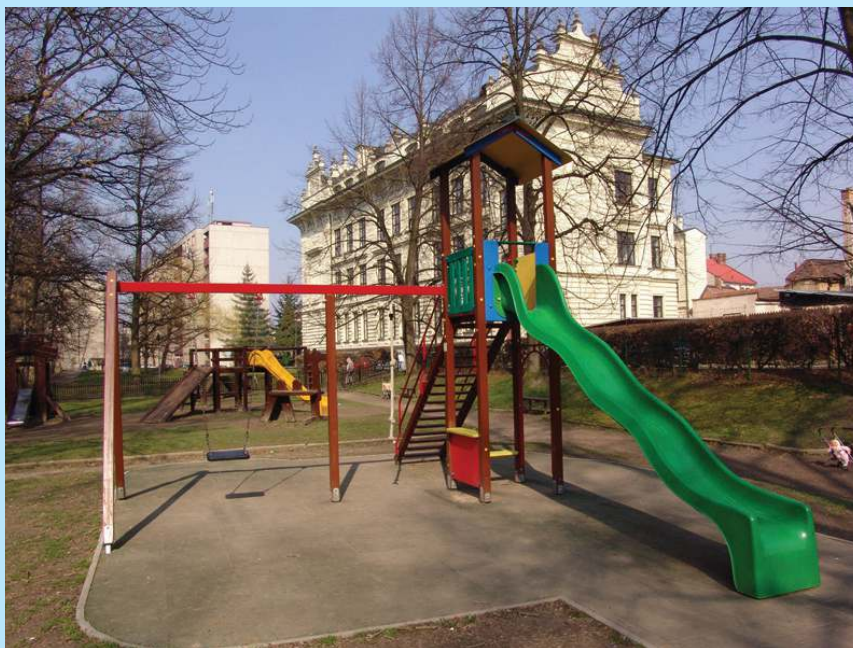
Zrekonstruované dětské hřiště na Vodních Valech v Litomyšli.