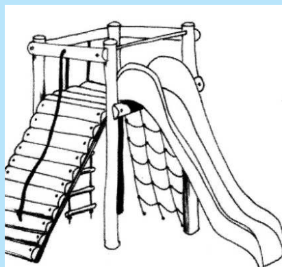
Herní prvek, který zakoupíme od firmy Dětská hřiště z Chotovic. Jeho cena činí 29 tisíc korun.