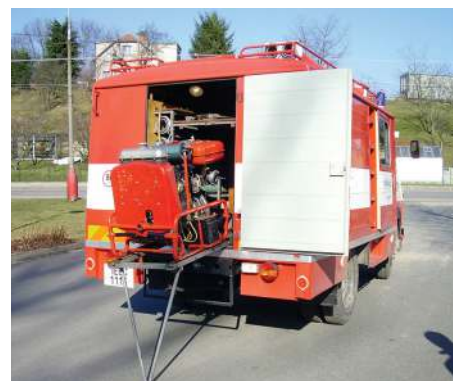
Požární vozidlo AVIA A31 pro úplné požární družstvo.

K zásahům slouží tisovským hasičům požární vozidlo AVIA A31 pro úplné požární družstvo. V účelové nástavbě je v přední části místo pro sedm osob a vzadu je upravena pro uložení požárního zařízení a příslušenství včetně motorové stříkačky PS 12 R. Ta je uložena na vodítkách, její vysunování umožňují sklápěcí můstky s pomocnými vodítky.