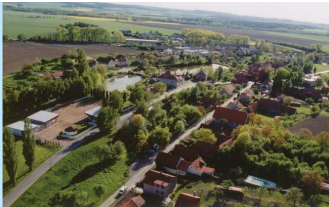
Letecký pohled na střed obce.