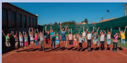
Školáci tráví volno na hřišti.

Přes prázdniny se ve škole a školce nezahálelo. Na školní budově je vyměněná střecha. Na zahradě mateřské školy přibily dva herní prvky, a to kolotoč a houpačky se skluzavkou a domečkem. V dnešní době je vyřešen i podklad pod pingpongovým venkovním stolem, a to