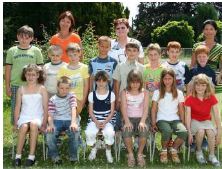
Školní rok 2007 - 2008.