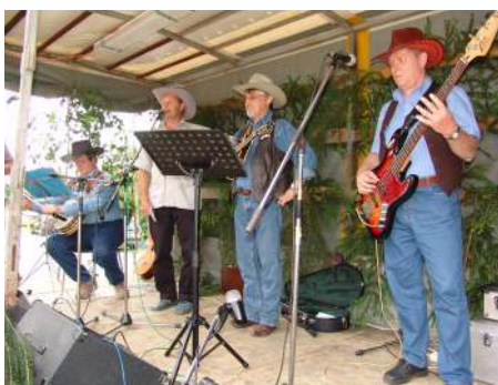
Populární country kapela Ponny Expres patřila k zlatému hřebu programu.