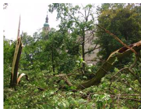
Bouře v zámeckém parku v Litomyšli poškodila 45 stromů.