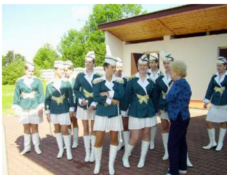
Přívabné mažoretky potěšily oko nejednoho návštěvníka.

V neděli 25. května, v rámci soutěže dětských dechových hudeb, se již tradičně v Tisové uskutečnil koncert, na kterém vystoupili žáci Základní umělecké školy z Opatovic a Jevíčka. Součástí koncertu bylo i vystoupení mažorettek. Na třicet posluchačů odměnilo účinkující bohatým potleskem. Vítězem XVI. ročníku Národní přehlídky dětských dechových orchestrů Čermákovo Vysoké Mýto 2008 se stal Dechový orchestr Základní umělecké školy z Vimperku. -red-