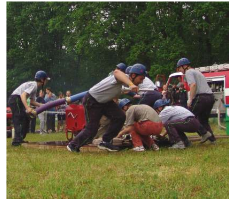
Požární útok.