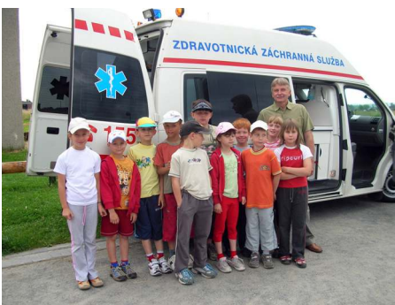
Žáci se seznámili s činností Zdravotnické záchranné služby.

Poslední školní dny strávily děti zajímavě, akce střídala akce. Školní učivo všichni zvládli bez problémů, nikomu žádný mráček náladu nezkalil. Do prázdninových dnů se vrhli s chutí a radostí. Všichni dospělí jim všem přejeme, aby se jim tyto letošní dva měsíce bezstarostného nicnedělání vydařily, aby byli všichni zdraví a spokojení, aby zažili spoustu zajímavých dobrodružství a aby se po prázdninovém odpočinku všichni zase s radostí vrátili do školních lavic. Eva Růžicková