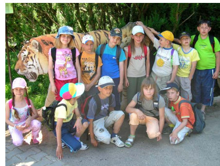
Žáci tisovské Základní školy v Zoologické zahradě ve Dvoře.