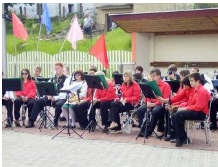
Dětský dechový orchestr ZUŠ Opatovice a Jevíčka.