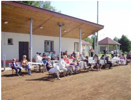
Spokojené tisovské publikum.