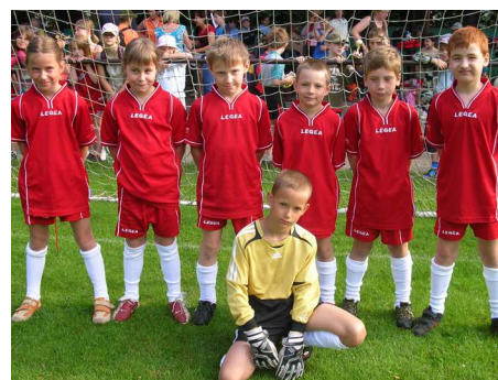
Fotbalový tým Tisové (zatím) pohár nepřivezl.